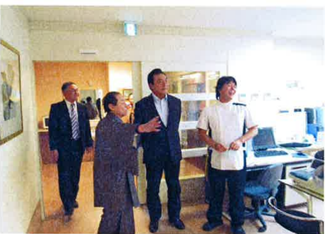
真剣な面持ちで説明を聞かれています！

去る11月20日に、介護老人保健施設ケアテル猪苗代、有床診療所マリアクリニックへ、俳優でタレントの高橋英樹さんがサプライズでご慰問頂きました。同敷地内のホテルリステル猪苗代においてドラマの撮影が行われ、撮影の忙しいスケジュールの中、ご利用者様へ激励の言葉を掛けたいとの意向により急遽お越し頂きました。高橋様は、ご利用者様に「頑張ってください」「励ましの言葉をかけていらっしやいました。身長187センチと恵まれた体格に、テレビで見るとこの容姿が「かっこいい」「迫力がある」とご利用者様からも思い思いの感想が飛び交いました。