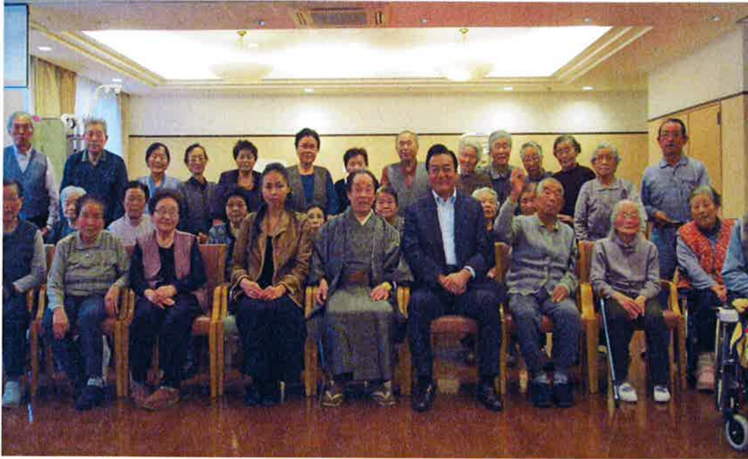
突然の高橋英樹さんの訪問にご利用者様もびっくり！