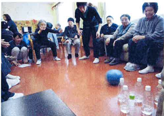
誰が一番ピンを倒せるか！！