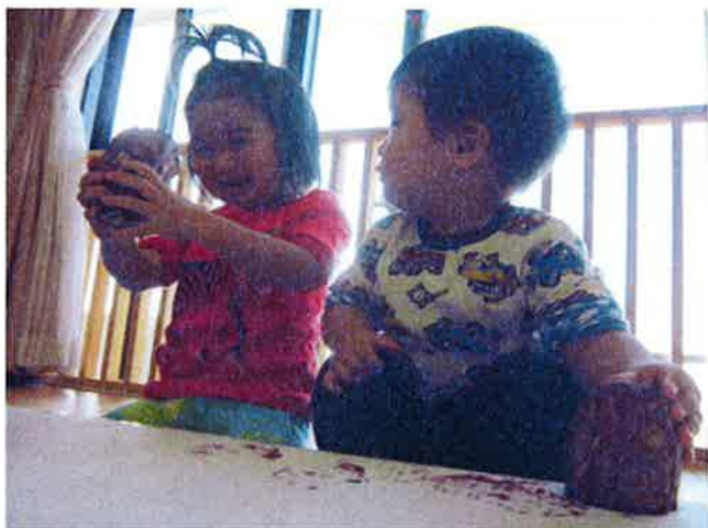
さつま芋ってこんな形なんだ！！おもしろい！！