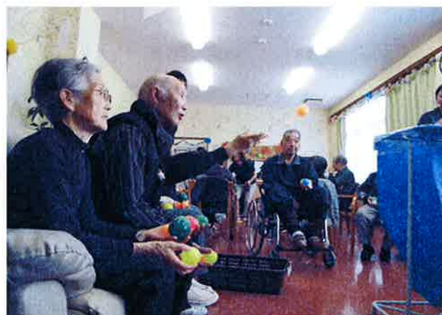
たくさん玉を入れてください！

デイサービス猪苗代では、11月26日に平成25年オリンピックを開催致しました。赤組白組に分かれて競技を行い、玉入れや輪送り等の団体競技では赤組が勝利を収め、金メダルが贈られました。ボーリングや輪投げ等の個人競技では、ハッスル賞やユーモア賞など、参加された利用者様全員に表彰状が贈られました。皆様、真剣に競技に挑まれ、『楽しかったね。』とメダルや表彰状を眺めながら大変喜ばれていらっしゃいました。