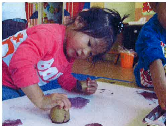
上手に押せるかな？よいしょ！よいしょ！

いろいろなものに興味を示す子ども達に、さまざまな分野において学ぶ時間を作っています。その中の『食育』では、秋の野菜について学び、さつま芋やじゃがいもにおいては感触を確かめたり、匂いを嗅いだり、半分に切ってみたり・・・最後には、芋ハンコをして楽しみました！