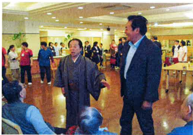
名俳優を紹介すると拍手が巻き起こりました。