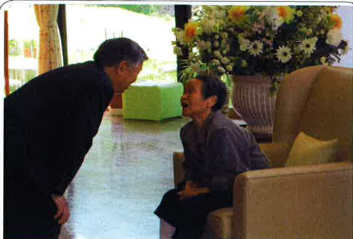
町長と元気にお話されています！