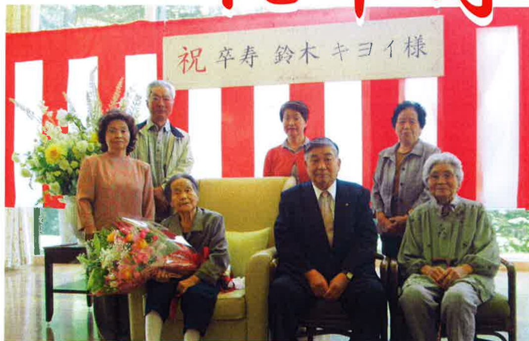
卒寿おめでとうございます！