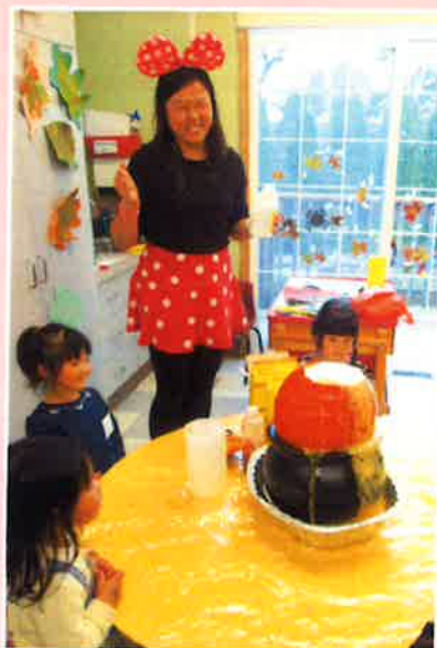
子ども達の顔より大きいかぼちゃ！

参加した家族からは「初めは緊張していた子どもたちでしたが、最後には楽しそうにコミュニケーションをとっていました。外国でしか体験できないようなことが出来て、とても有意義な時間を過ごせました。」とのお話をいただきました。