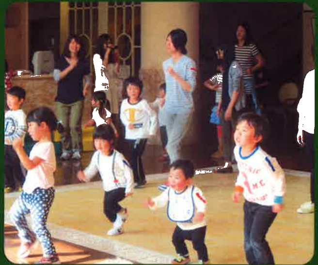
みんなで元気にジャンプ！ジャンプ！