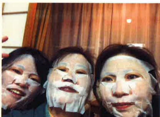
温泉のあとのワンシーン！