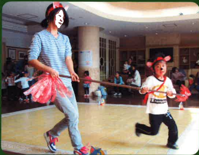
お母さんと一緒に頑張ろう！