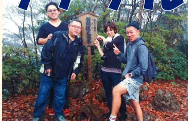
人気パワースポット御岩神社！