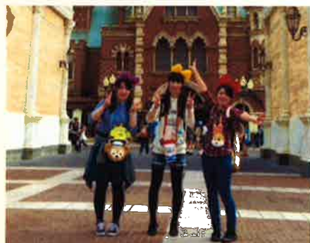
夢の国東京ディズニーシー！

医療法人ケアテルでは、従業員を対象に年に1回慰安旅行を実施しております。2名以上であれば好きな人たちと好きな場所へ行くことが出来ます。 今年10月半ばから12月初旬にわたり、12組が参加しました。山形県米沢市にて旬のものを食べ、温泉でゆっくり休むグループや、人気アトラクションパークで閉園まで楽しむグループがいたり、思い思いに楽しみました。 不規則な勤務形態で働いている職員たちは、日々の疲れを癒せたことと思います。この慰安旅行を通じて更なるサービスの向上を目指して参ります。