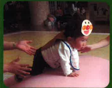
がんばれ！がんばれ！ 上手にはいはいできるかな？！

事業所内保育施設 ミニテル保育園では10月24日に「森の運動会」を開催しました。