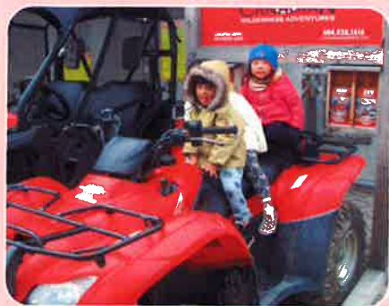
大きなバイクにも乗りました！