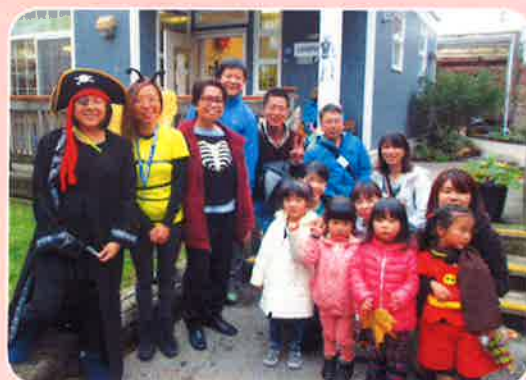
保育施設にて記念撮影！