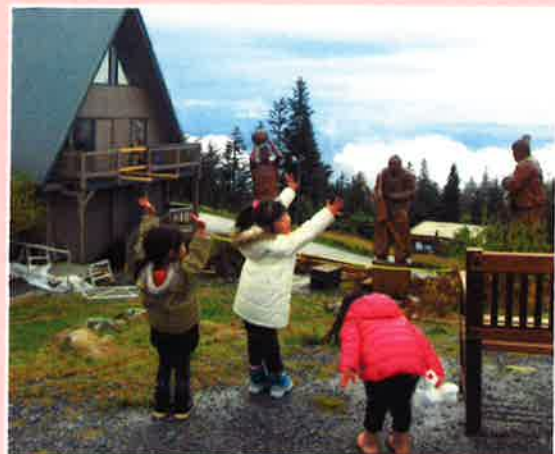
バンクーバーの景色が一望出来ました！