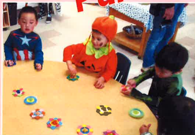
みんなでコマを作りました！