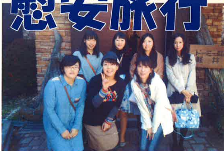
軽井沢にて！ショッピング楽しかった！！