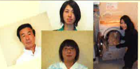
ケアテルではこの人！！

大きな葉っぱに黄色い花を咲かせるきゅうり。そんなあなたは、美的感覚にすぐれ、愛くるしい魅力のある人です。美しいものとそうでないもの、価値のあるものとないものを見分ける力があります。ひとつのことにこだわり、しっと深い所がありますが、優雅に振舞えるので、人々に愛されます。