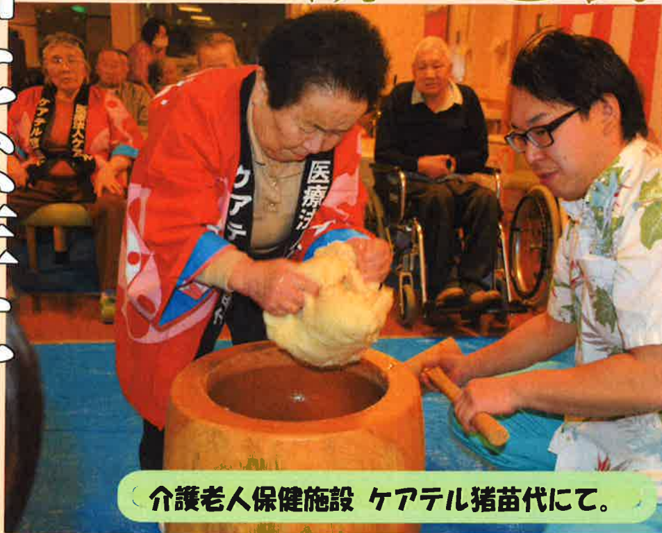
介護老人保健施設 ケアテル猪苗代にて。