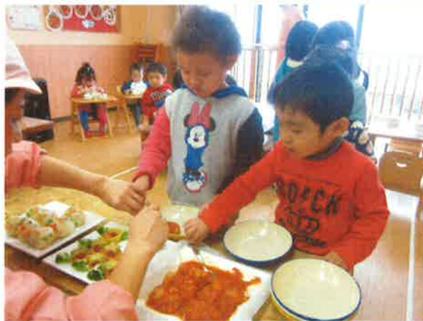
おいしそう！いっぱい食べたいよ～！

認可施設 ミニテル保育園では、12月22日に園内行事「クリスマス会」を開催しました。