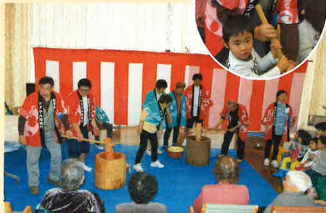
男性と女性が担当に分かれてあっという間に完成！