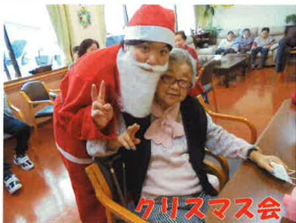
菅野サンタがサプライズ登場！ ご利用者様も大喜び...？