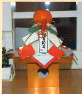
立派な鏡餅が完成しました！

医療法人ケアテル 福島県耶麻郡猪苗代町 川桁字元寺2403-1 TEL 0242-66-3030(代)