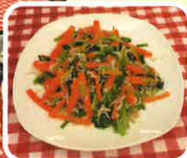
あっという間に完成です!