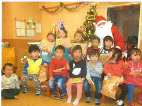
プレゼントを届けてくれたサンタクロースと記念撮影！