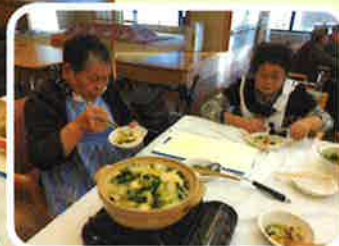
お味はいかがでしょう?