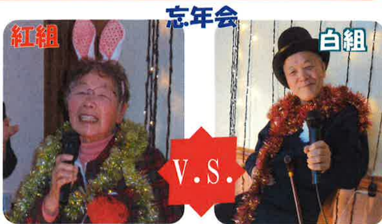
忘年会の1枚。さて軍配はどちらにあかったのでしょうか？！

ケアテルデイサービスセンター ハーブの園猪苗代では、12月23日に「クリスマス会」を開催し、マジックショーを行いました。ご利用者様にもマジックを体験して頂き、「まるでマジシャンになったみたい～！」と大変喜んで頂きました。また、12月27日には「忘年会」で紅白歌合戦を行い、多くの利用者様に美声を披露していただきました。