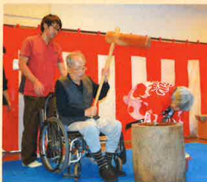
息を合わせて「ヨイショ！ヨイショ！」