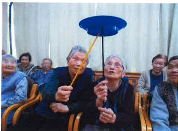
お皿を慎重に受け渡しをします。