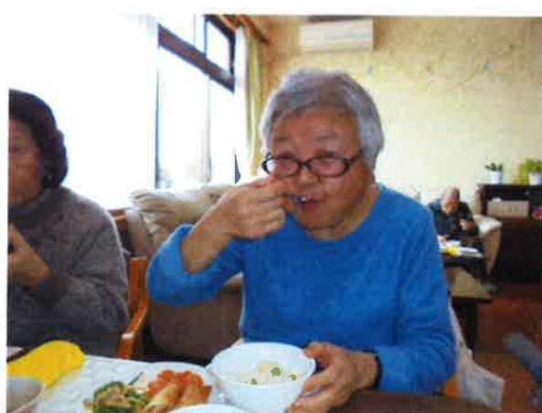
お腹いっぱい食べました！

デイサービスハーブの園猪苗代では、平成30年2月19日（月）に行事「春節」を開催しました。春節とは中国の旧正月に行われるイベントで、昼食はエビチリや春巻き、チャーハンなどの盛り沢山の中華バイキングを堪能していただきました。職員による余興では中国雑技団、皿回し、猿回しを披露し、ご利用者様にも皿回しに挑戦していただきました。職員が回した皿を棒で受け取り、隣の方へリレーしていくと、成功する毎に大きな歓声が上がリ、お腹も心も満たされた楽しい一日を過ごしていただきました。