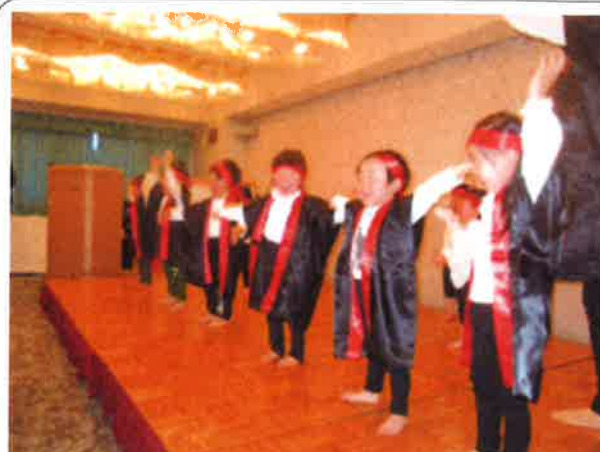
かっこよく踊るぞ！！

認可保育施設ミニテル保育園では、3月24日（土）に卒園式とお別れパーティーを行いました。平成29年度に卒園するお友達は6名、退園するお友達は5名、計11名のお友達と別れを惜しみました。卒園式では厳粛な雰囲気の中、園長より卒園証書が手渡され、立派にお礼の言葉を言う姿に成長を感じました。リステルで行われたお別れパーティーでは、毎日頑張って練習した“よさこい”を元気に披露したり、“さよならぼくたちのほいくえん”を全員で歌いながら、園児・保護者の皆様・職員全員で感動的な時間を過ごすことができました。