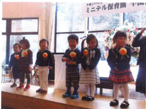
こんなに大きくなりました！！