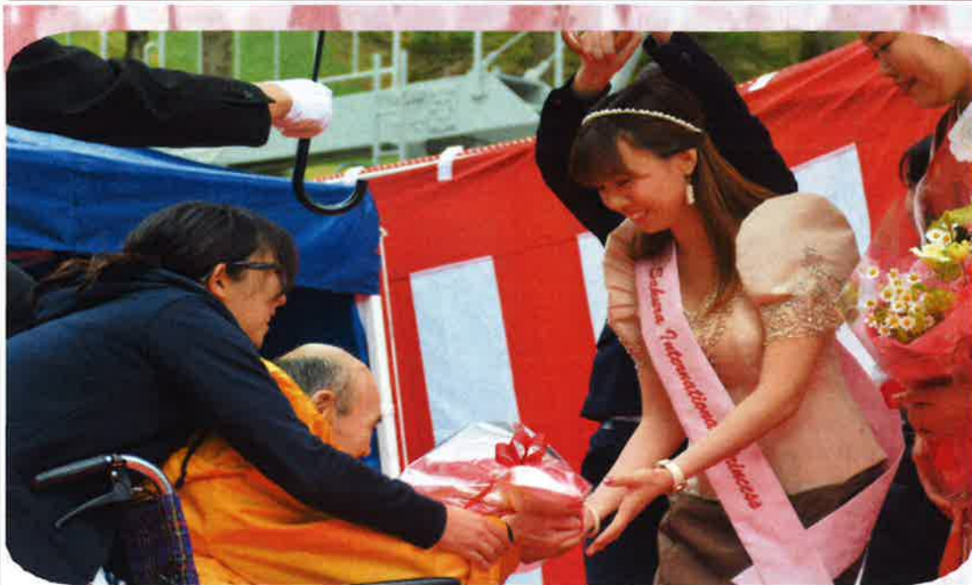
▲ご利用者様代表からフィリピンのさくらプリンセスへ花束の贈呈！