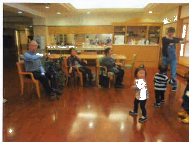
一緒に体操いっちに♪さんし♪

ドワークラスに進級した2歳児の子どもたちが初めての通所訪問に行って来ました。最初は、ドキドキの子どもたち！！利用者様の笑顔に迎えられて、緊張もほぐれタッチや握手をして触れ合いました。また、利用者様と一緒にラジオ体操をしました。体を動かし元気いっぱいの子もたち☆