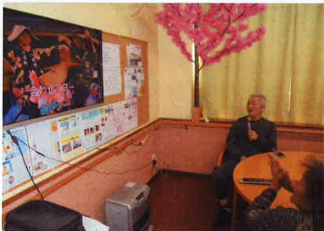
素敵な歌声も聴かせて頂きました♪