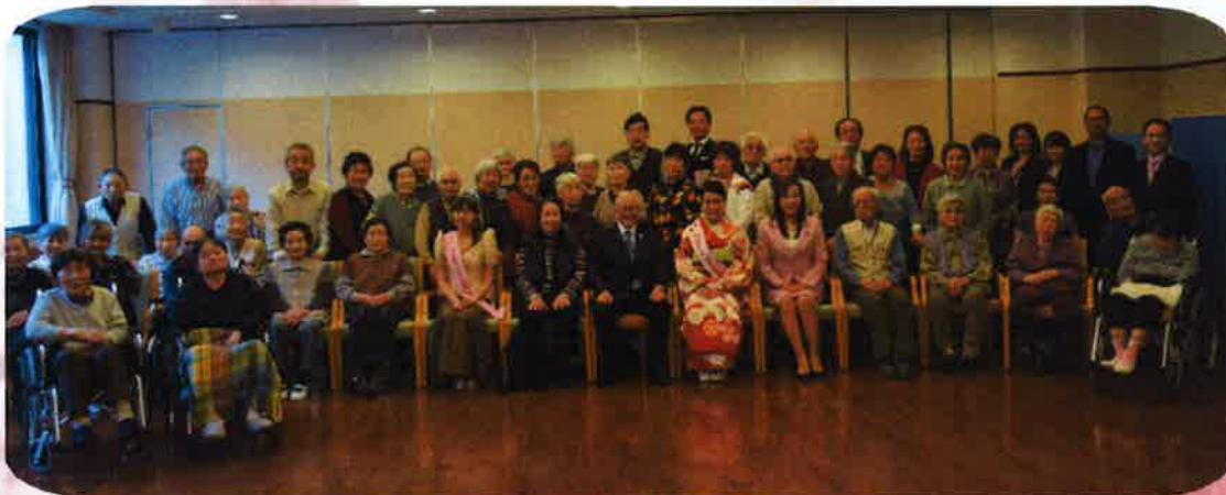
▲通所リハビリテーションのご利用者様と一緒に記念撮影を行いました。