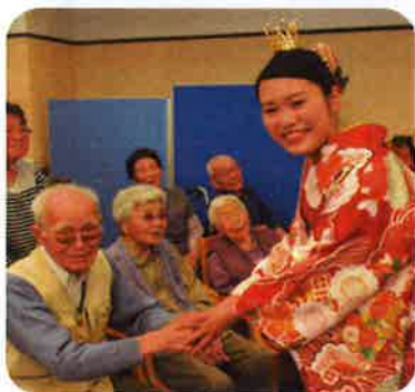
▲さくらプリンセスと握手！