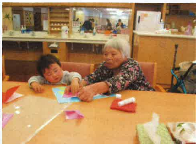
上手にできたかな♪