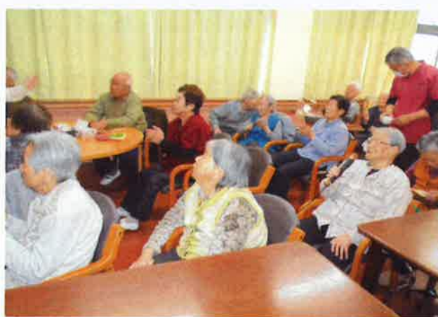
皆さん真剣に聴いています！

デイサービスハーブの園猪苗代では、平成30年3月22日（木）に行事「民謡教室」を開催しました。ご利用者様がご持参された民謡の本を見ながら懐かしい思い出話をされ、楽しく選曲していらっしゃいました。又、利用者様お一人お一人の十八番も披露していただき、皆さんで手拍子や手の振り付け、鳴子を片手に、笑顔でカラオケに参加されました。素晴らしい歌声が溢れる一日となりました。