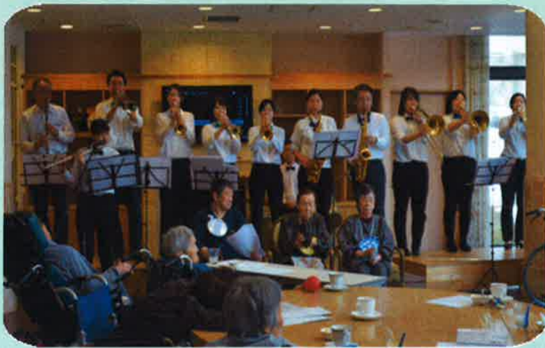
▲様々な曲を利用者様と一緒に楽しんで演奏しています♪

ケアテル猪苗代では毎週月曜日と金曜日の十時と十五時から二公演で有志メンバーによるビッグバンドの定期演奏会を行っております。チームのメンバーのほとんどが楽器の未経験者ではありますが、時間を見つけて日々練習に励んでいます。利用者様にもタンバリンやマラカスなどの楽器を使って一緒に盛り上げて頂き私も楽しく演奏が出来ています。毎回参加していただいている方には景品もごさいます。皆勤賞目指して一緒に楽しみましょう！