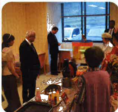
▲おやつの部屋の見学の様子

してと様にをいなそ善ホだピ施 た親の子ももくりの「テきン設 去 。善記でとつつま後桜の「リしま大ケる を念してたすたサ植スたがテ月 深撮たも施か。プ樹テ。御ル24 らも最味で「使イ「猪の問苗に、 れ行後をす「はズが苗日、いへ介 たわに持「の「で執のりに同ら駐 一れはた「なよ均ご行て敷し日老 日、ごれど「な年訪わ友地てフ人 と桜利てい、な役齡問れ好内いイ保 な用る施役問れ好内いイ保 り通者る施役問れ好内いイ保 まじ様ご設割はと、親のたり健