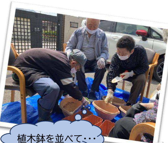
植木鉢を並べて・・・