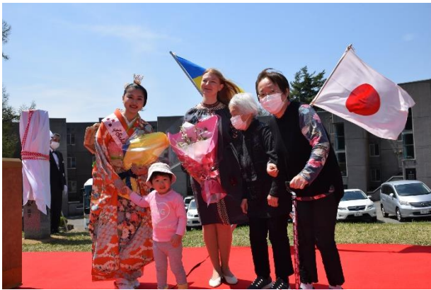
ミニテル園児ご利用者様より花束贈呈！