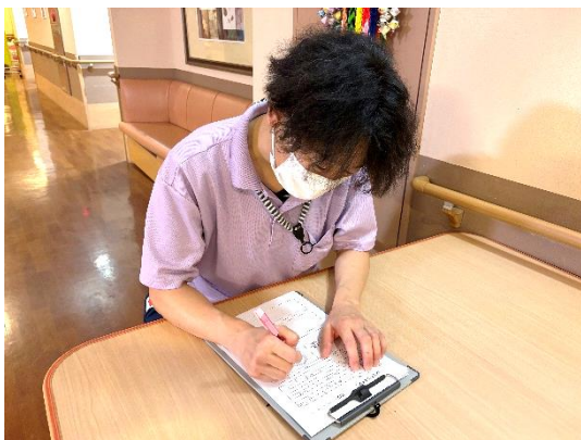
口腔内の状況を記載しています。