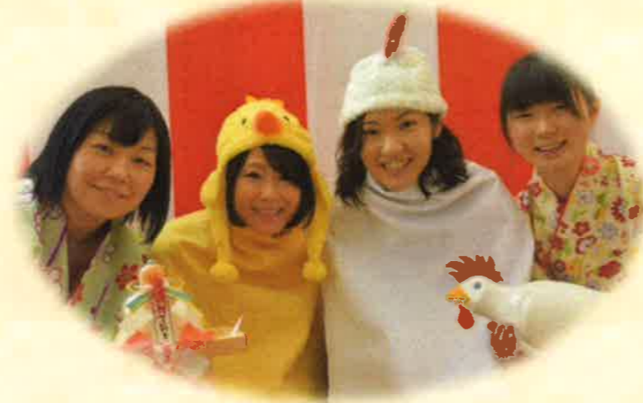
幸せを取り(酉)込み、皆様のご健康と ご多幸を祈願申し上げます。

あけましておめでとうございます。 昨年は、介護老人保健施設ケアテル猪苗代の運営に際し、多大なるご協力を賜り誠にありがとうございました。