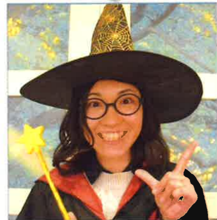
石川ポッター 知って安心講座 ～介護保険区分変更編～