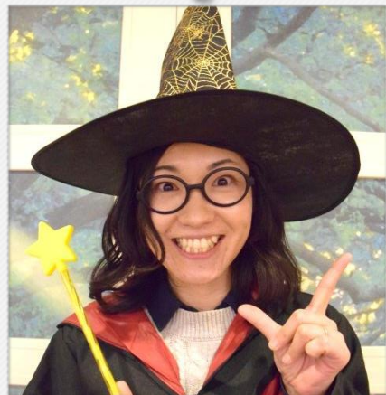
石川ポッター 知って安心講座

A、市町村の介護保険窓口申請可能です。非課税世帯の方や所得に応じて該当になるかが決定されます。